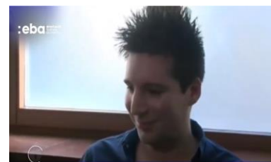
Análise Comportamental Rui Pinto (Aqui)