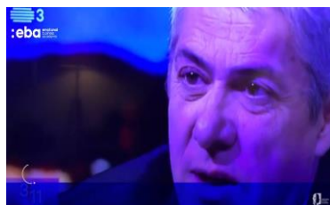
Análise Comportamental José Sócrates (Aqui)