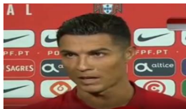
Análise Comportamental Cristiano Ronaldo (Aqui)