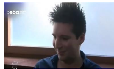
Análise Comportamental Rui Pinto (Aqui)