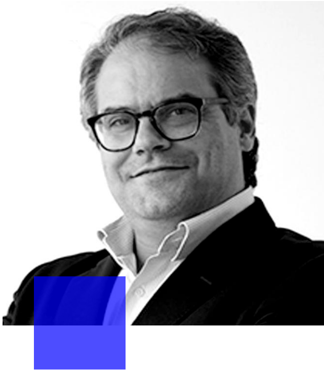
Francisco Lucena Consultoria de Comunicação

Vasto know-how e experiência na atividade de consultoria e gestão de comunicação empresarial, com mais de 20 anos de atividade no sector.