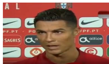
Análise Comportamental Cristiano Ronaldo (Aqui)