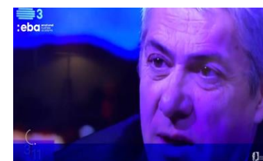
Análise Comportamental José Sócrates (Aqui)