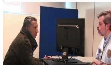
Análise Comportamental Entrevista SEF (Aqui)