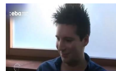
Análise Comportamental Rui Pinto (Aqui)