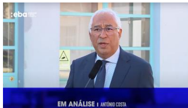
Análise Comportamental António Costa (Aqui)