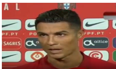
Análise Comportamental Cristiano Ronaldo (Aqui)