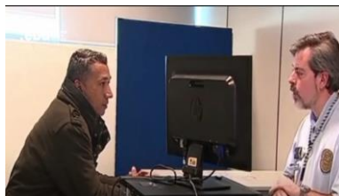
Análise Comportamental Entrevista SEF (Aqui)