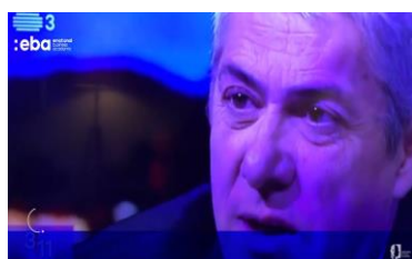
Análise Comportamental José Sócrates (Aqui)