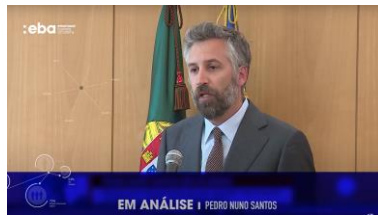
Análise Comportamental António Costa (Aqui)