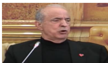
Análise Comportamental Joe Berardo (Aqui)